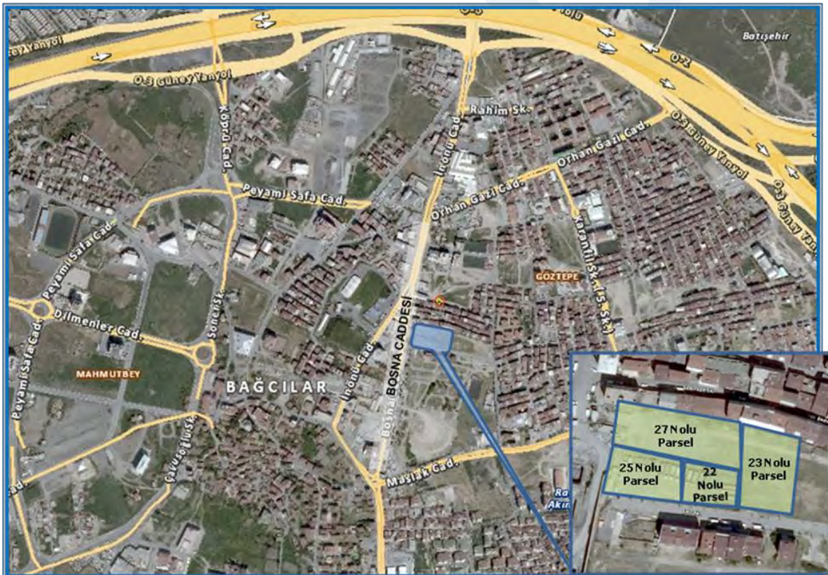
(EK : 1: Gayrimenkullere Ait Fotoğraflar)

Değerleme konusu gayrimenkuller Bağcılar İlçesi, Göztepe Mahallesi'nde yer almaktadırlar. Yakın çevrelerinde ağırlıklı olarak imalathaneler ve nitelsiz konut alanları yer almaktadır. TEM Otoyolu'na yaklaşık 1,6 km. mesafede yer alan parsellerin yakınından yapımı devam eden Otogar-Bağcılar Hafif Metro hattı geçmektedir. Söz konusu gayrimenkuller; TEM Otoyolu Mahmutbey-Aksaray bağlantı Yoluna 900 metre uzaklıkta ve Bağcılar İlçesi'nin en önemli arterlerinden olan, kuzeyde İSTOÇ gibi iş alanları ile güneyde konut alanları arası bağlantıyı sağlayan Mahmutbey Yolu'nun devamı olan Bosna Caddesinin üzerinde yer almaktadır.